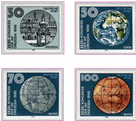
Diese Briefmarken erschienen am 02.10.1990.