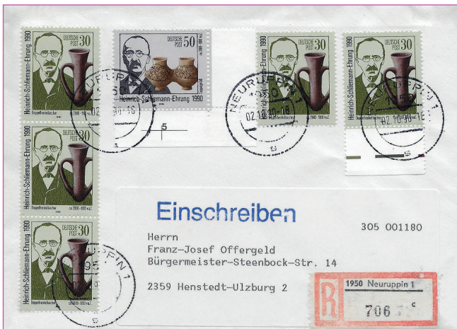
Der 02.10.1990 ist der letzte Tag der DDR. Damit handelt es sich bei dieser Briefmarkenserie um die allerletzten Briefmarken der DDR.