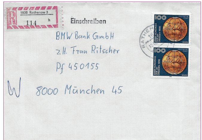
Einschreibebrief in die BRD vom 10.10.1990 von RATHENOW 3 nach München. Briefporto (VGO) bis 20 g kosteten 50 Pf., zusätzliche Einschreibetaxe 150 Pf. Die Bundesrepublik Deutschland galt als Inland.