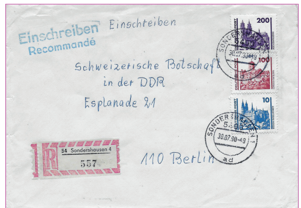
Einschreibebrief vom 30.07.1990 von SONDRERSHAUSEN nach Berlin 110 (Ost), Mehrfarbenfrankatur, Briefporto von 20 bis 250 g kostete 160 Pf., zusätzliche Einschreibgebühr 150 Pf.

Die Briefmarken mit der Inschrift «Deutsche Post» waren noch bis zum 31. Dezember 1991 im ganzen vereinten Deutschland frankaturgültig. Sie wurden aber nur bis zum 31. Dezember 1990 von der Post verkauft.