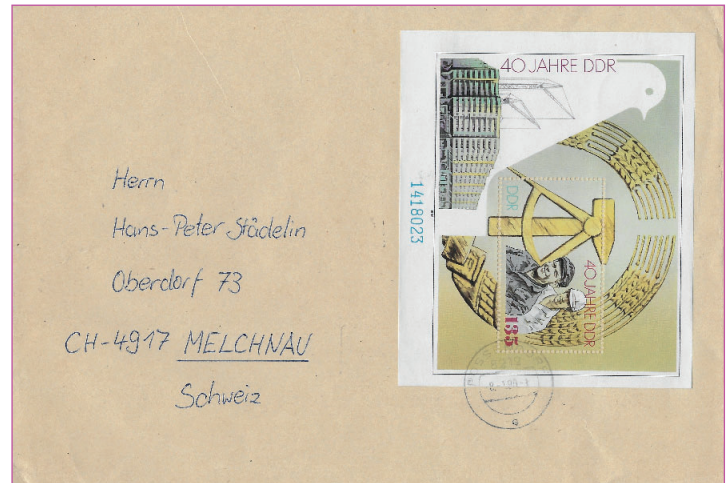
Brief Ausland, von POSSENDORF nach Melchnau in der Schweiz, vom 08.01.1990, überfrankiert. Die Gebühr für Auslandsbriefe 20 – 100 g betrug 80 Pf.

Noch am 3. Oktober 1989 legte die Post der DDR die Jubiläumsausgabe «40 Jahre Deutsche Demokratische Republik» mit einem Sonderblock mit einem Frankierwert von 135 Pf. auf. Augenfällig ist die grosse Schrift DDR und das übergross aufgeführte Staatswappen der DDR, welches die Einheit von Arbeiter, Bauern und Intelligenz durch die Elemente Hammer, Zirkel und Ährenkranz symbolisiert.