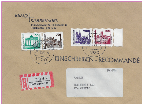
Einschreibebrief im Fernverkehr vom 26.09.1990 von Berlin 1000 nach Wunsdorf, Mehrfarbenfrankatur, Brieftaxe (BRD) von 20 - 50 g kostete 170 Pf., zusätzliche Einschreibgebühr 250 Pf.