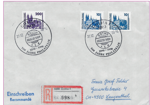
Eingeschriebener Brief ins Ausland vom 31.12.1990 aus GOTHA 1 nach Langenthal CH, Mehrfarbenfrankatur mit Sonderstempel Gotha 1 entwertet. Brieftaxe (VGO) bis 20 g kostete 70 Pf., Einschreibgebühr 150 Pf.

Die Marken «Deutsche Post» wurden sowohl im Verkehrsgebiet Ost als auch im Verkehrsgebiet West verwendet. Es gab im VGO viele Mischfrankaturen, da ältere DDR-Briefmarken und Marken der Deutschen Post Berlin noch bis zum 31. Dezember 1991 gültig waren. Besonders gesucht sind sogenannte Dreiländerfrankaturen, die jedoch im normalen Postverkehr selten vorkommen.