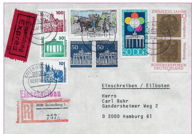
Eingeschriebener Brief per Express befördert vom 02.07.1990 von BOIZENBURG 1 nach Hamburg, Mischfrankatur, Brieftaxe (VGO) bis 20 g kostete 50 Pf., zusätzlich Einschreibgebühr 150 Pf. und Expresszustellungsgebühr 200 Pf.