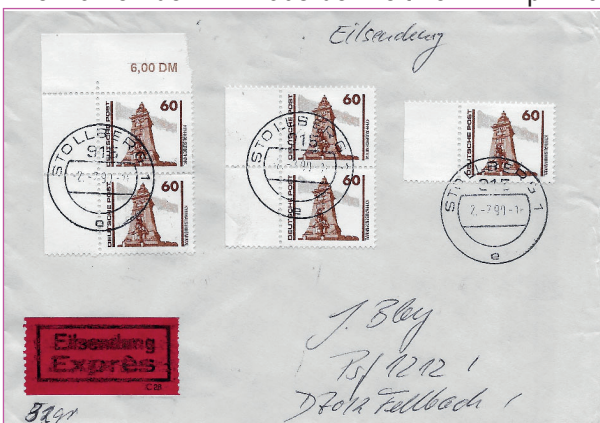
Express-Inlandbrief vom 02.07.1990 von STOLLBERG 1 nach Fellbach, Mehrfachfrankatur, Brieftaxe (VGO) von 20 - 50 g kostete 100 Pf., zusätzliche Expressgebühr 200 Pf.

Briefmarken der DDR aus der Zeit vom 1. April 1964 bis 30. Juni 1990 blieben im Verkehrsgebiet Ost (VGO) bis zum 2. Oktober 1990 gültig. Bis zum 31. März 1991 bestanden dort eigene, bereits deutlich erhöhte Gebühren. Ab dem 1. April 1991 wurden die noch höheren Postgebühren der Bundesrepublik angewendet. Ab dem 1. Juli 1990 galten die Bundesrepublik und West-Berlin aus Sicht der DDR nicht mehr als Ausland. Das galt auch umgekehrt.