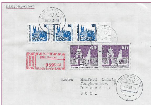
Einschreibebrief im Ortsverkehr vom 19.07.1990 in DRESDEN. Mischfrankatur. Brieftaxe bis 20 g kostete 50 Pf., zusätzliche Einschreibgebühr 150 Pf.

Die Marken «Deutsche Post» wurden sowohl im Verkehrsgebiet Ost als auch im Verkehrsgebiet West verwendet. Es gab im VGO viele Mischfrankaturen, da ältere DDR-Briefmarken und Marken der Deutschen Post Berlin noch bis zum 31. Dezember 1991 gültig waren. Besonders gesucht sind sogenannte Dreiländerfrankaturen, die jedoch im normalen Postverkehr selten vorkommen.