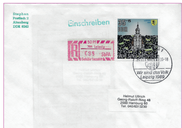
Eingeschriebener Brief ins Ausland vom 20.03.1990 mit Sonderstempel LEIBZIG. Einzelfrankatur, Briefporto bis 20 g kostete 35 Pf., zusätzliche Einschreibebgebühr 50 Pf. Dieser R-Zettel ist aus einem Selbstbedienungspostamt (SbPA). Sie waren bis zum 31.07.1990 gültig. Ausgabe der Zuschlags-Briefmarke war der 28.02.1990.